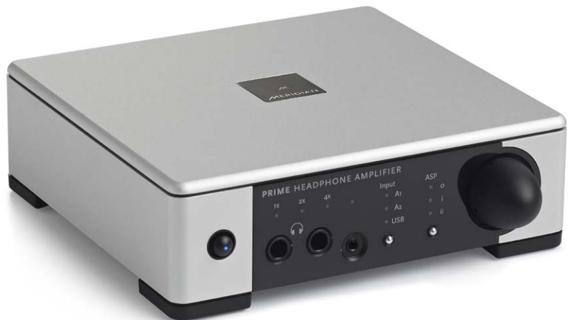
Das elegante Design des PHA ist mit HiFi-Komponenten und Computern kompatibel

Trotz wachsenden Interesses an hochwertigen Kopfhörern und adäquater Peripherie wird im Allgemeinen die Bedeutung separater Kopfhörer-Verstärker unterschätzt: Viele Musikfreunde haben nie erfahren, wie stark Kopfhörer klanglich von einer hochwertigen Kopfhörer-Vorverstärkung profitieren; die an sich begrüßenswerte Tatsache, dass viele Vorstufen und Vollverstärker sehr gute Kopfhörer-Vorstufen beinhalten, trägt zur Vernachlässigung der separaten Spezialisten bei. Darüber hinaus sehen viele Musikhörer einen Kopfhörer-Verstärker als Krönung eines außergewöhnlich hochwertigen Kopfhörers an, dabei sind spezialisierte Vorverstärker-Stufen nicht nur für High-End-Modelle interessant: Auch preiswerte Kopfhörer des mittleren HiFi-Segments und vergleichbare In-Ear entfalten ihr ganzes