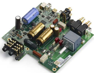
Die Platine des PHA ist durchweg mit hochwertigen Bauteilen bestückt. Das solide Metallgehäuse und spezielle Gerätefüße schützen sie vor Vibrationen

Meridian-typisch erscheint der kleine PHA als smarte, schicke und - für traditionell geprägte Klangfreunde - damit mehr oder weniger zugleich harmlose Komponente, doch dieses Vorurteil erweist sich auch dieses Mal als trügerisch. Dank seiner zwei 6,3mm-Klinken-Eingänge können Enthusiasten High-End-Kopfhörer, die über getrennte