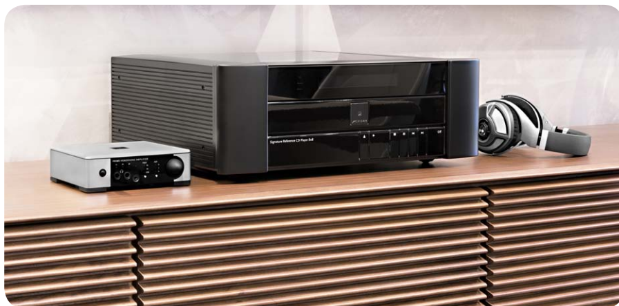
Der PHA eignet sich auch für das Zusammenspiel mit Referenz-Komponenten wie dem Meridian 808