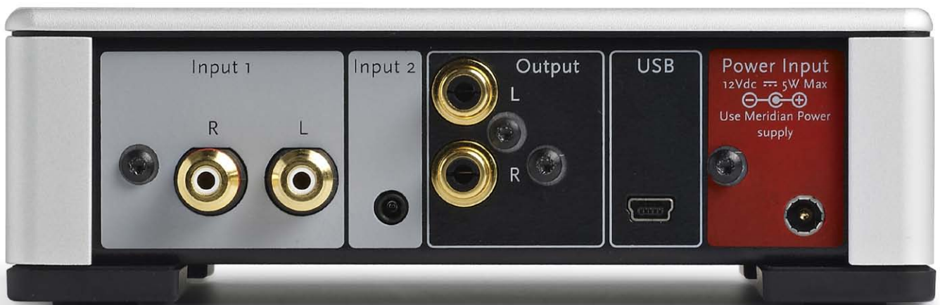
Der Vorverstärker-Ausgang ist abschaltbar. Ab sofort ist auch das Netzteil „Prime Power Supply“ verfügbar, dass dem PHA klanglich den letzten Schliff gibt

Auf der Platine finden sich selbstverständlich nur hochwertige, ausgesuchte Bauteile, die feinfühlig abgestufte analoge Lautstärkeregelung übernimmt ein Potentiometer vom Spezialisten ALPS, das durch einen ergonomisch geformten Drehregler angesteuert wird. Die weiteren Qualitätsmerkmale und Funktionen des PHA sind wiederum hauptsächlich digitaler Signalverarbeitung und damit dem ureigensten Metier von Meridian zu verdanken.