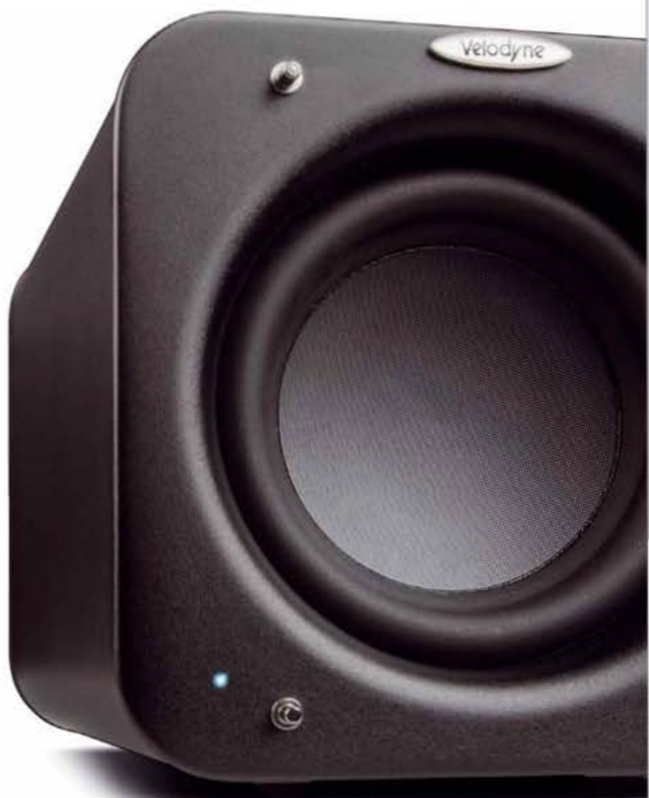
Velodyne SPL-800i: Kraftpaket im Mini-Format